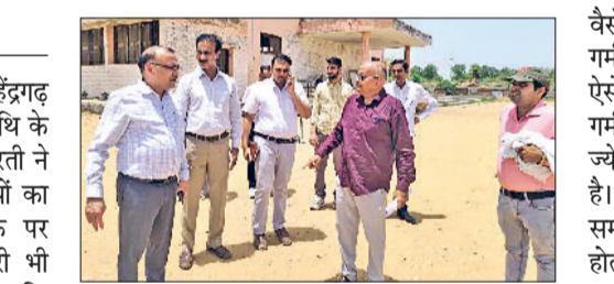
महेन्द्रगढ़। रेली स्थल का जायजा लेते डीसी विवेक भारती।

मुख्यमंत्री नायब सिंह सेनी आगामी 18 मई को महेन्द्रगढ़ स्थित स्टेडियम में धन्यवाद कार्यक्रम में मुख्यातिथि के तौर पर शिरकत करेंगे। उपयुक्त डॉ. विवेक भारती ने कार्यक्रम स्थल पर तैयारियों का जायजा लिया। इस मौके पर अनेक विभागीय अधिकारी भी मौजूद रहे। डीसी ने बताया कि मुख्यमंत्री 18 मई को कार्यक्रम स्थल पर ही जिले की लगभग 30 परियोजनाओं का उद्घाटन तथा शिलान्यास भी करेंगे। कार्यक्रम स्थल पर चल रही तैयारी के संबंध में उन्होंने अधिकारियों को निर्देश दिए कि कार्यक्रम में पेयजल की उचित व्यवस्था होनी चाहिए। वहीं पर्याप्त मात्रा में शौचालय की भी व्यवस्था होनी चाहिए, ताकि आम