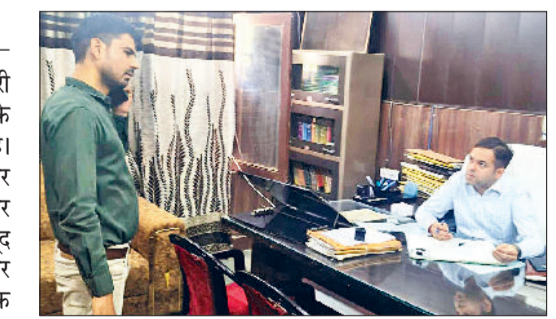
नारनौल। रटाफ कर्मचारियों से बातचीत करते एसडीएम।