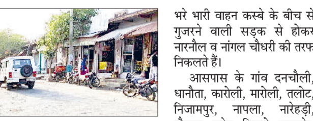
नारनौल। निजामपुर की सड़क, जहां बीच बाजार से गुजरते हैं भारी वाहन।

निजामपुर में बाइपास निर्माण महज एक सपना बनकर रह गया है। प्रदेश में पिछली सरकार में डिप्टी सीएम रहे दुर्घत चोपला ने करीब दो वर्ष पहले एक जनसभा के दौरान इसको तैयार करने के लिए वॉर्क करोड़ 18 लाख रुपये की राशि मंजूर की थी, जिसका निर्माण कार्य आज भी अधर में लटका हुआ है। जानकारी के अनुसार गांव छिलरों में नारनौल रोड से लेकर वाया दनचौली रोड होते हुए निजामपुर बीडीपीओ ब्लॉक के पास खेतड़ी रोड को जोड़ने वाला यह बाइपास बनना था, जो खटई में पड़ता दिखाई दे रहा है। कस्बे के दुकानदारों के द्वारा पिछले करीब तीन वर्ष से ये लोग सरकार से मांग करते आ रहे थे। क्योंकि निजामपुर कस्बा का रोड मात्र 42 फुट चौड़ा है, जहां अनेक दिनादर अफवाकड़ डंपर एवं अन्य छोटे व भारी वाहन यहां से गुजरते हैं। यहां राजस्थान के जिला झुंझुनूं व सीकर से रोड़ी, बजरी व पत्थर से