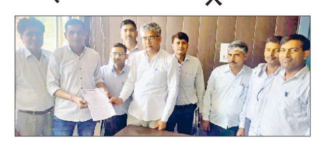
नारनौल। ज्ञापन सौंपते एसोसिएशन के पदाधिकारी।

विभागीय आदेशों की पालना एवं कर्तव्यनिष्ठा का इनाम बिजली निगम के जेई एवं एलएम को जिल्लात एवं ट्रांसफर मिला है। हुआ यूं कि कनीना क्षेत्र में एक उपभोक्ता निगम का डिफाल्टर चल रहा था तथा उसकी तरफ करीब एक लाख रुपये की राशि बकाया हो चुकी थी, जिस पर निगम ने उसका कनेक्शन काटने के आदेश जारी कर दिए। जब जेई कनेक्शन काटने पहुंचा तो संबंधित व्यक्ति ने सत्तारूढ़ दल का कार्यकर्ता होने का अहम दिखावा और स्टेट में किसी पॉवरफुल आका को फोन लगाकर कनेक्शन काटने गए जेई व एलएम का ट्रांसफर कनीना से सीधे धारुहेड़ा करवा दिया। इससे बिजली निगम कर्मचारियों में रोष बना हुआ है तथा उन्होंने निगम अधिकारी को ज्ञापन देकर कर्मचारी के साथ हुए उत्पीड़न की दुहाई देते हुए उनसे ट्रांसफर