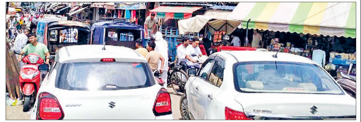
महेन्द्रगढ़। शहर के बालाजी चौक के समीप लगा जाम।

सब्जी मंडी रोड व शॉपिंग कॉम्प्लेक्स में अतिक्रमण की भरमार