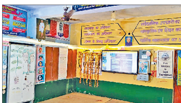
नारनौल। अकबरपुर स्कूल में तैयार की गई राजनीति विज्ञान लैब।

प्रदेश में पहली बार सरकारी स्कूल में राजनीति विज्ञान लैब तैयार, नहीं लगा सरकारी पैसा